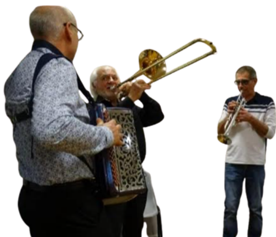
Le Comité des fêtes relance les traditions et prépare l'été

Relancée par le comité des fêtes, la Saint-Vincent fait son retour à Sougé avec un programme convivial et ouvert à tous, autour de la vigne, du vin et du plaisir de se retrouver.